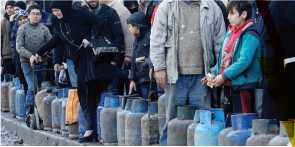
Şam’daki gaz krizinin fotoğrafı

Yakıt krizinin, yakıtın doğrudan gerekli olduğu elektrik, su ve iletişim gibi devlet hizmetlerinde daha fazla düşüşe yol açacağı düşünülmektedir.