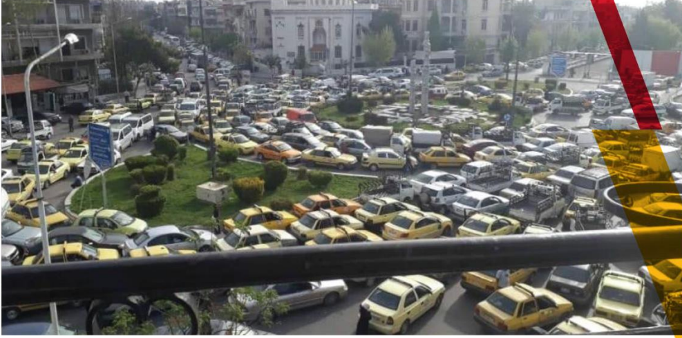
Şam’da izdiham (benzin istasyonundaki kuyruklar)

kalacağı anlamına geliyor. Bu ise işsizlik oranlarının artacağı, karaborsa, kaçakçılık ve yasa dışı yollarla malzeme temini işlerine daha çok girileceği anlamına gelmektedir.